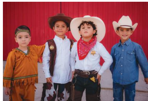
Muy contento en compañía de sus amigos.