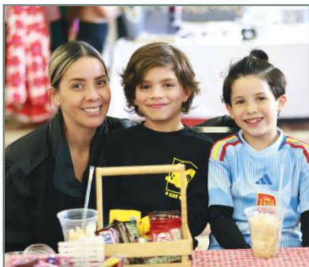
En familia disfrutando de un rato agradable.