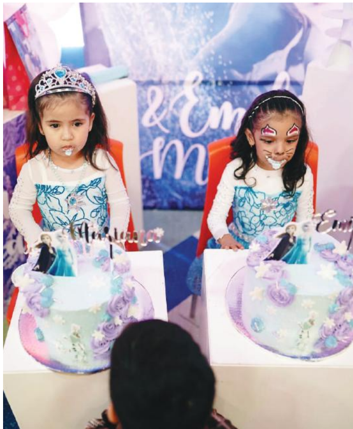
Las festejadas durante el momento que partieron pastel.