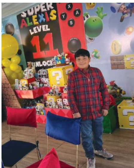
El cumpleaños disfrutó de todos los detalles de su festa.