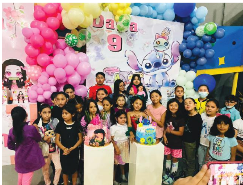
Amigos y familiares se sumaron a la fiesta de cumpleaños número 11.