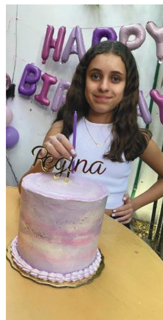
Con un simbólico pastel disfrutó de su festejo.

A hora indicada, le cantaron las mañanitas y con ello, los deseos de la cumpleañera, quien apagó así la simbólica velita. Posteriormente, disfrutó del rico pastel junto a sus seres queridos, quienes la llenaron de cariño y felicitaciones.