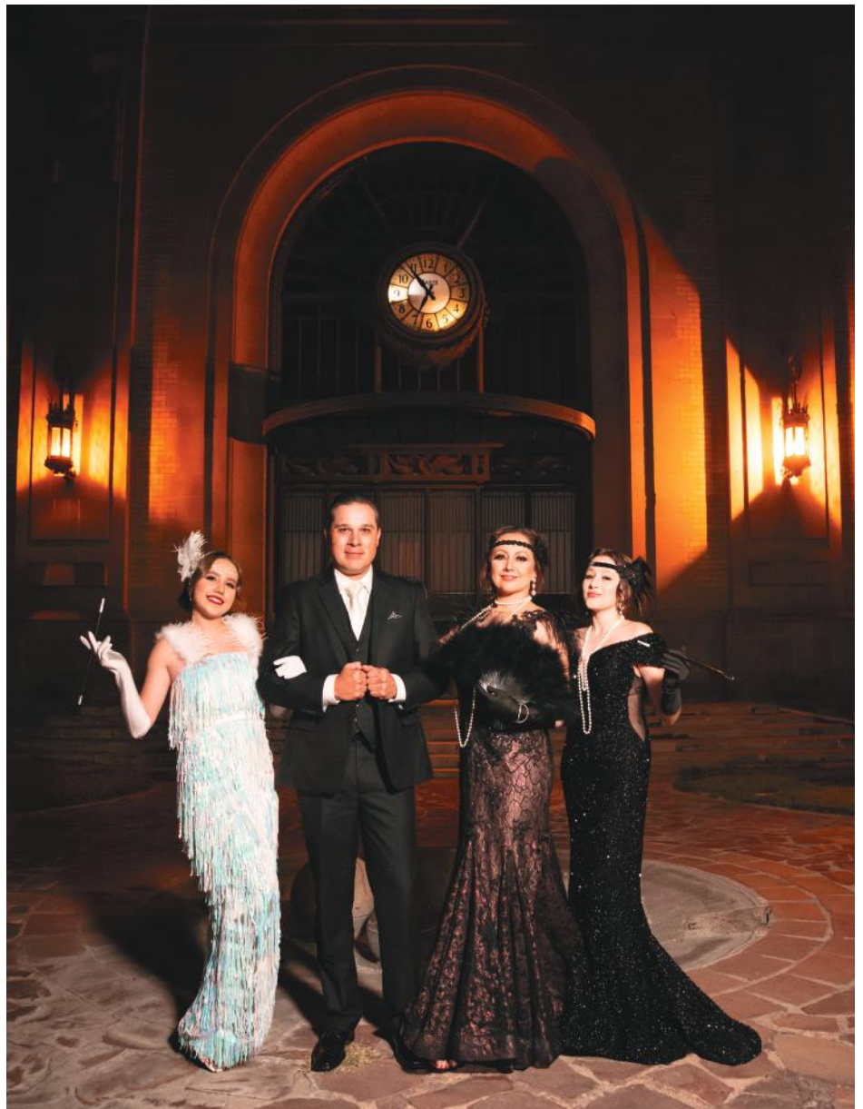
Rodeada del cariño de su familia, la quinceañera disfrutó de su festejo.