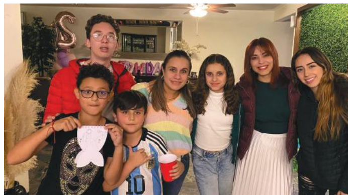
Gratos momentos junto a su familia.