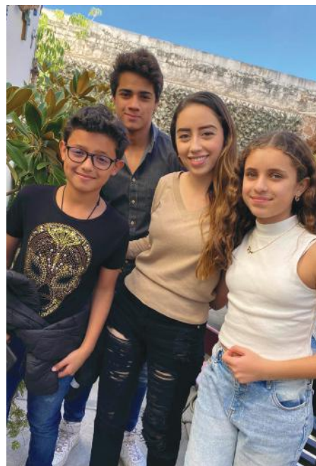
Emotivas muestras de cariño recibió en su día.