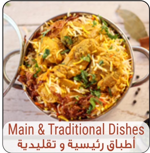
Main & Traditional Dishes أطباق رئيسية و تقليدية