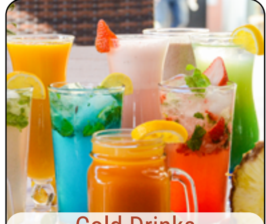
Cold Drinks المشروبات الباردة