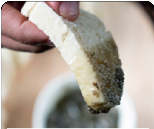
Add Ons اضافات