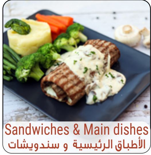
Sandwiches & Main dishes الأطباق الرئيسية و سندويشات