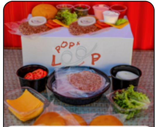
Barbeque Box باربيكيو بوكس