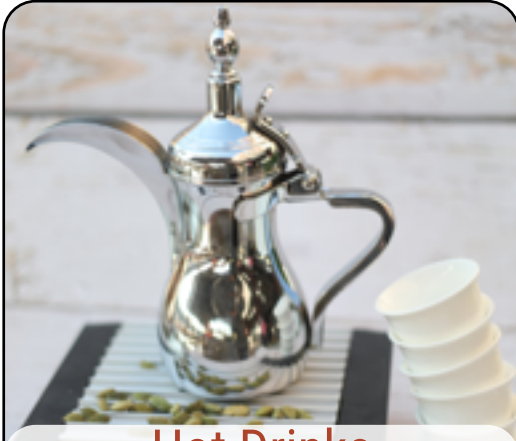
Hot Drinks المشروبات الساخنة