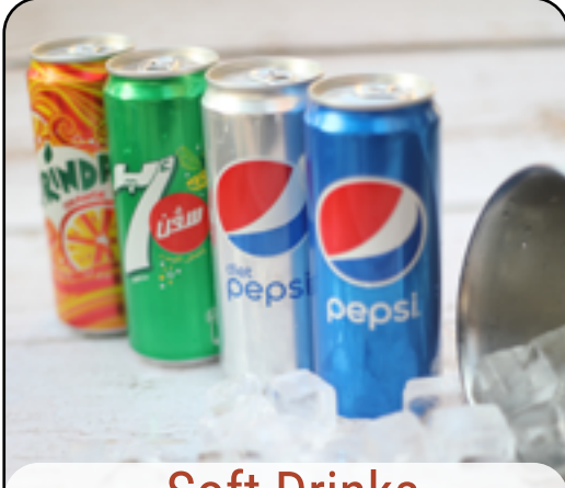
Soft Drinks المشروبات الغازية