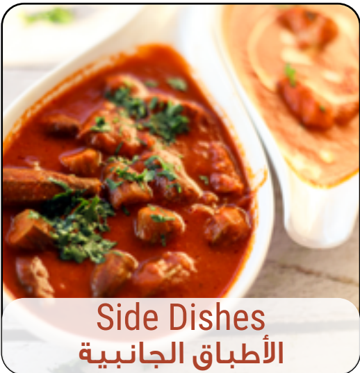
Side Dishes الأطباق الجانبية