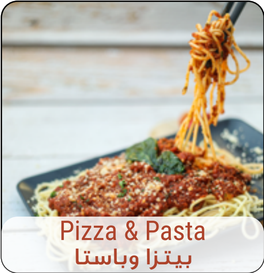
Pizza & Pasta بيتزا وباستا