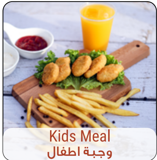
Kids Meal وجبة اطفال